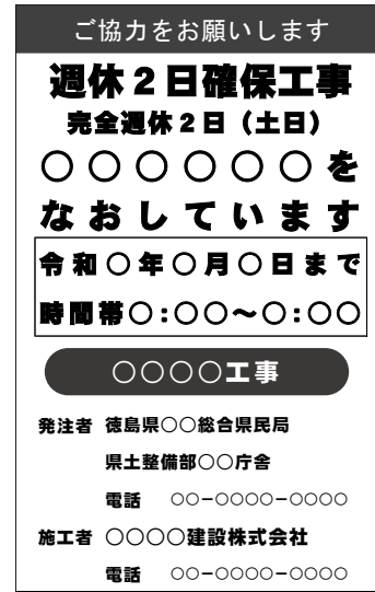
(標示板記載例) 完全週休2日(土日)の場合